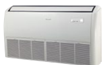
Parapetně-podstropní FDMX 50/70