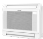
Parapetní XDMX 35/50